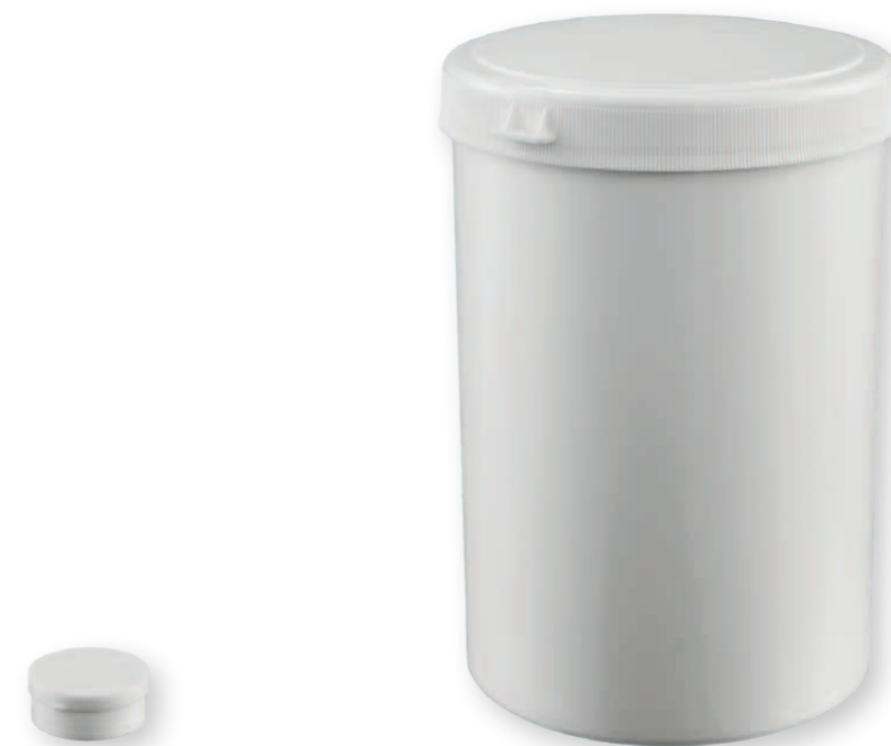
Stülpedeckeldose 10 ml

Unsere Stülpedeckeldosen haben ein Volumen von 10 ml bei einem Durchmesser von 33,55 mm oder 2500 ml Volumen bei einem Durchmesser von 133 mm.